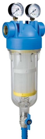
HYDRA M - RSH

Pro zajištění správné a dlouhodobé činnosti je vhodné filtrační zařízení doplnit regulátorem tlaku, např. CALEFFI 5334 a kompenzátorem hydraulických rázů CALEFFI 525. Obě zařízení dodává naše firma.